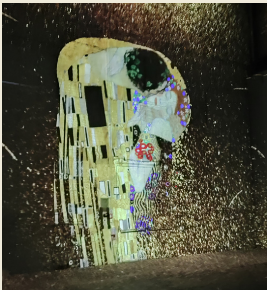
“Le Baiser” de Gustav Klimt

Le premier week-end passé avec Gerda et Ulli nous avons visité une exposition animée intitulée “ Phoenix des Lumières”, sur les artistes Gustav Klimt, Hundertwasser, puis avons visité dimanche la ville de Cologne et sa cathédrale.