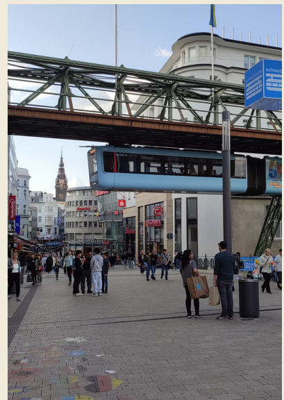
der Schwebebahn in Wuppertal

Gerda et moi sommes également allées à Wuppertal et avons traversé la ville dans le “Schwebebahn”, puis mangé dans un restaurant turc, c’était sincèrement superbe, j’ai passé une excellente soirée en sa présence !